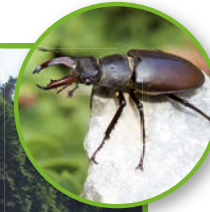
Layout: scriptus-ebrach.de Fotos und Illustrationen: Kathrin Michaelis, fotolia.com